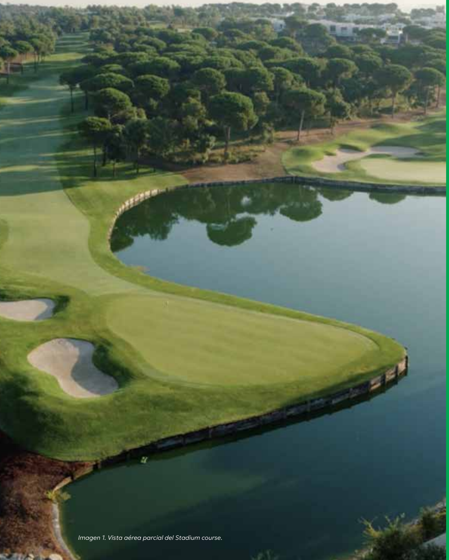
Imagen 1. Vista aérea parcial del Stadium course.