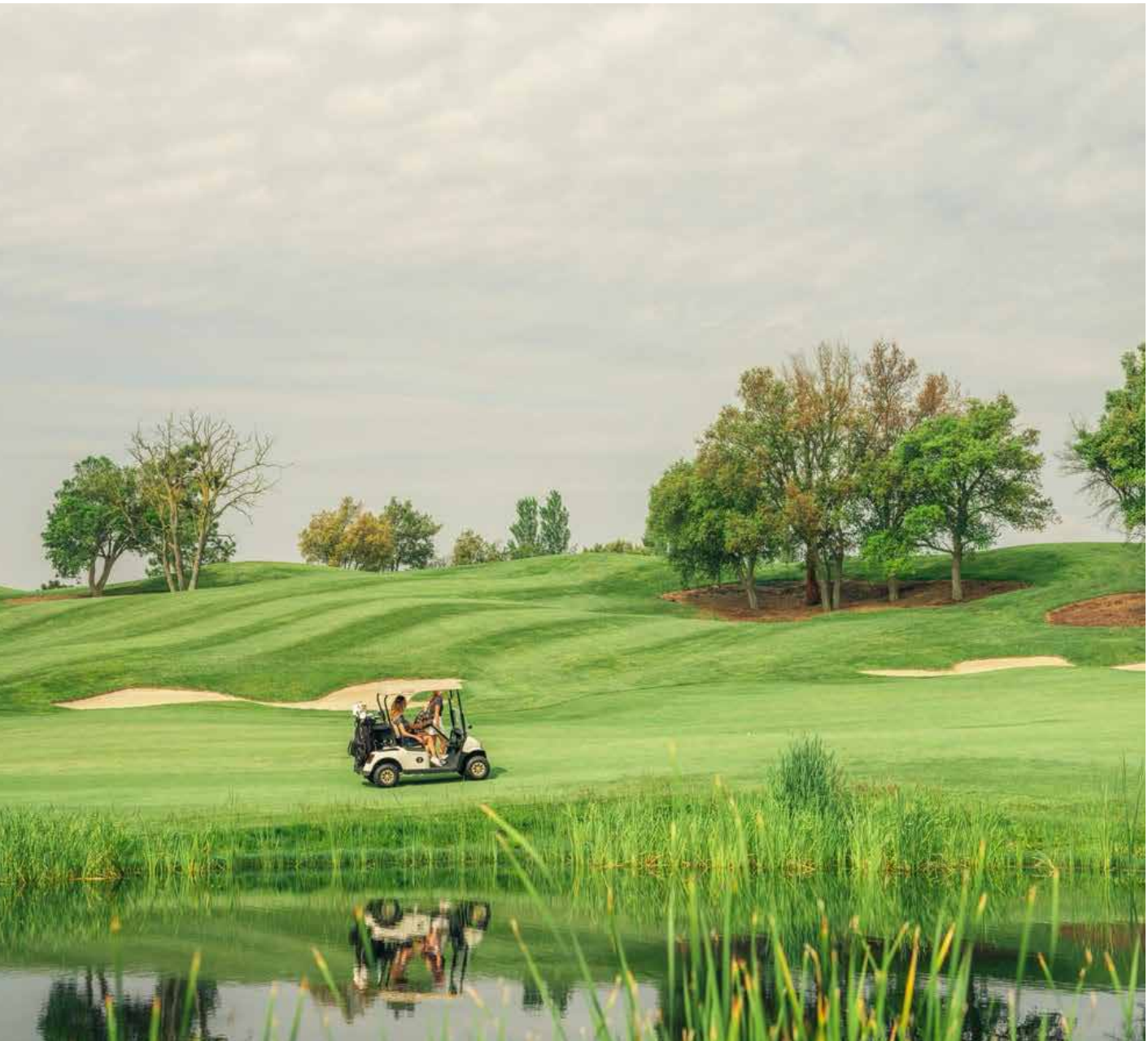
Imagen 4. Jugadores en la calle del hoyo 12 disfrutan de su cuidado paisajismo.

Estas prácticas aseguran que Camiral pueda mantener su calidad de juego (exigente en el Stadium Course , versátil en el Tour Course ) mientras actúa como un líder responsable en el uso de recursos críticos.