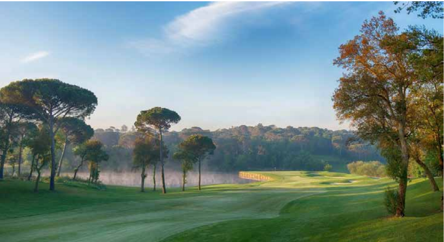
Imagen 5. Calle del hoyo 3.

El compromiso de Camiral con la eficiencia energética y la generación propia, materializado en la instalación de dos plantas fotovoltaicas refleja una estrategia proactiva para reducir los costes operativos asociados al consumo eléctrico y reforzar su resiliencia económica. La notable disminución del consumo energético comentada con anterioridad confirma que la inversión en tecnología no solo es ambientalmente responsable, sino también una decisión financieramente acertada.