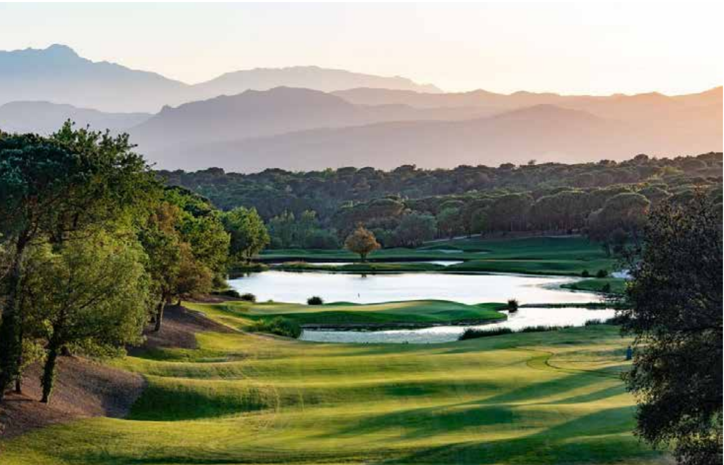
Imagen 3. Imagen del lago

Con anterioridad, se ha comentado que el agua de riego de Camiral es exclusivamente agua regenerada. Sin embargo, esta agua posee algunos problemas que son importantes para la gestión agronómica de las cespitosas. El principal aporte de agua a la EDAR de Caldes de Malavella es el efluente de una planta embotelladora local. Esta procedencia genera un agua con un alto contenido en sodio y bicarbonatos. La conductividad oscila entre los 2000 y 3000 microSiemens/cm con concentraciones de sodio elevadas que llegan hasta los 450 mg/l. Por ello, la gestión de la calidad del agua es un factor crítico en el mantenimiento, ya que altas concentraciones de sales, más concretamente de sodio, pueden dañar el suelo y el sistema radicular del césped. Por ello, la elección de céspedes resistentes a las sales del agua resulta esencial, como el Paspalum vaginatum el cual se ha incluido en calles y tees del Stadium Course .