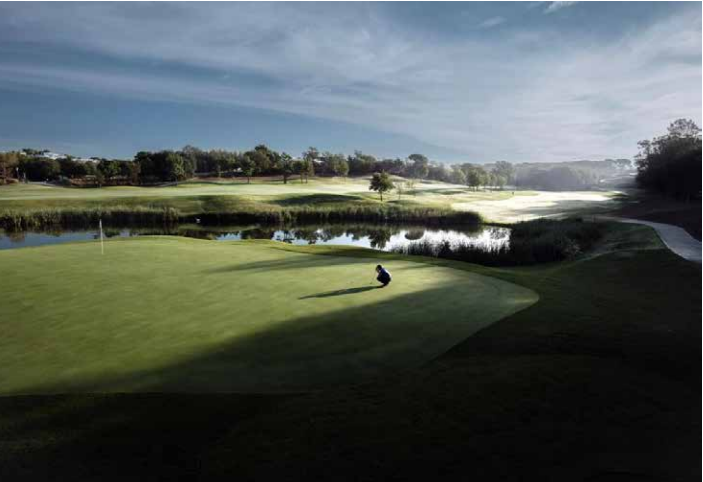
Imagen 2. El jugador y el desafío.

El Gobierno catalán, por su parte, ha hecho una clara apuesta por la sostenibilidad en el marco de la organización del evento. Específicamente, se ha garantizado que el riego se realizará con agua regenerada y se trabajará activamente para que el evento sea respetuoso con el medio ambiente, asegurando un legado sostenible y social.