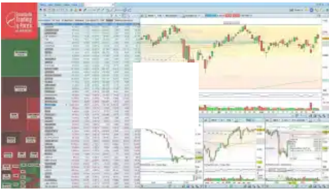
Así cierra el Ibx 35