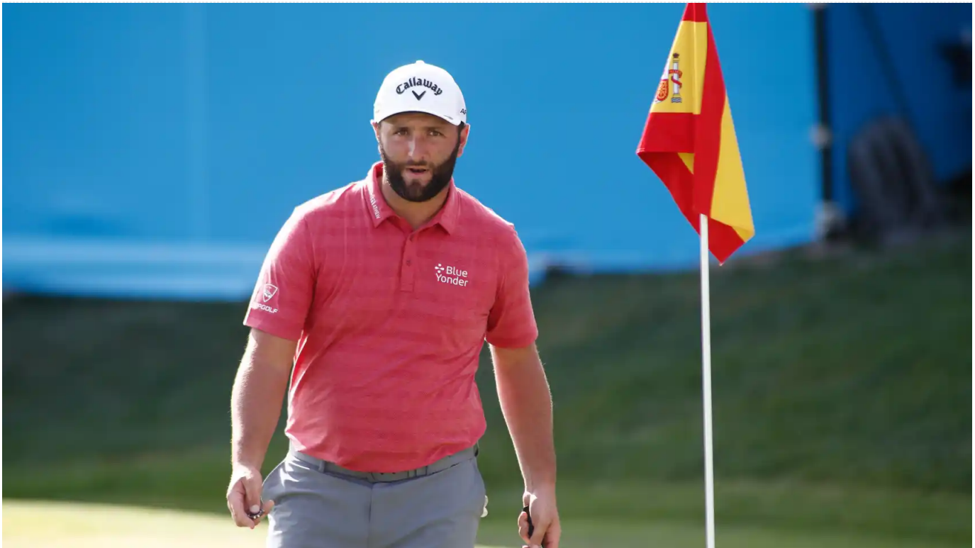
Jon Rahm, en el Acciona Open España of Golf, celebrado en Madrid, en octubre de 2021.

DIRECTO Elecciones generales | Sánchez prescinde de piezas clave de su equipo de Igualdad