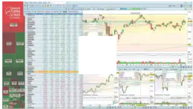
Así cierra el Ibx 35