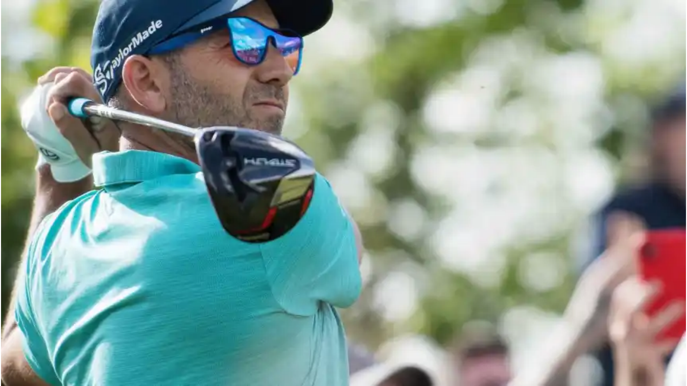
Sergio García, en el 2022 LIV Golf Invitational Series, en Londres.

Arabia Saudí ha logrado arrancar un acuerdo de fusión entre la estadounidense PGA Tour , el europeo DP World Tour y la saudí LIV Golf . En los últimos años, la competencia entre las tres organizaciones ha provocado disputas en los tribunales y una ralentización de la afición.