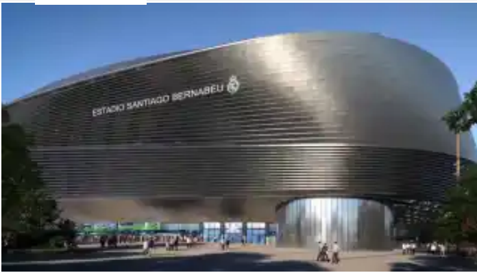
Mahou logra un acuerdo con el Real Madrid para tener un espacio "relevante" en el nuevo Santiago Bernabéu