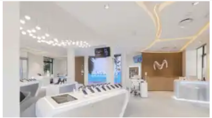
Telefónica, Orange y Vodafone recurren a regalar o financiar móviles, televisores o freidoras para atar a sus clientes