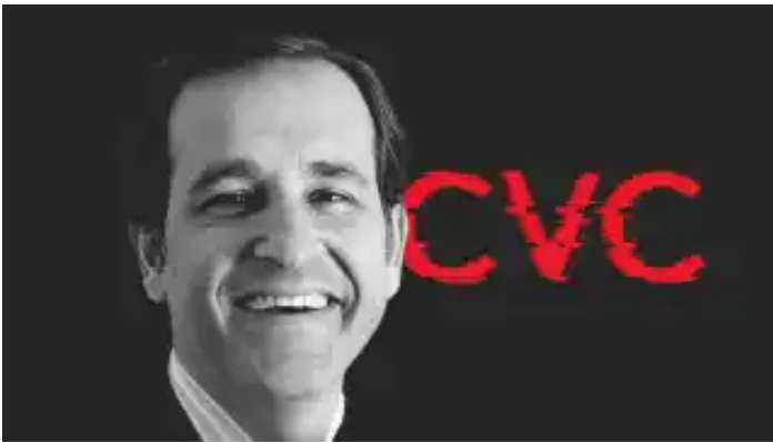
Javier de Jaime: así ha influido en el fútbol, aceite, textil o sanidad el cauteloso jefe de CVC investigado por Hacienda