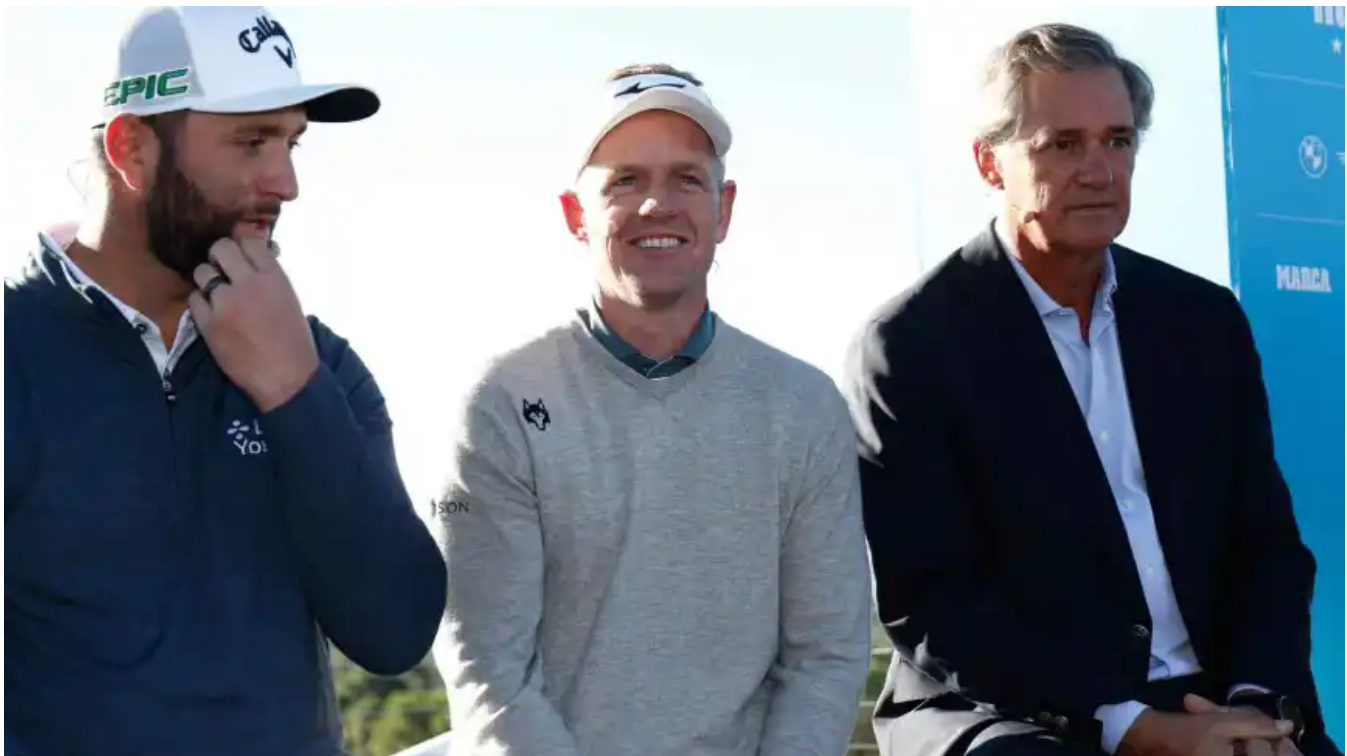
Los jugadores Jon Rahm y Luke Donald, junto con el presidente de Acciona, José Manuel Entrecanales, en 2021.

"España es una potencia en el European Tour", afirma Jorge Sagardoy , director gerente de la Real Federación Española de Golf . "Atrae a 1,2 millones de turistas; cuando en otros países no se puede jugar, en otoño, invierno, aquí se puede jugar en mangas de camisa, y vienen jugadores de todas partes de Europa", dice. "El primer Open de Golf de España se organizó en 1912, el jugador número uno del mundo es español... Y ahora en Valderrama se disputa el torneo de LIV Golf", añade.