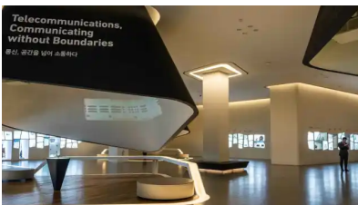
Dentro del Samsung Innovation Museum (SMI)