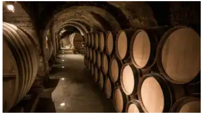
600 años de la bodega más longeva de España: de elaborar vino para misa a exportar a 36 países